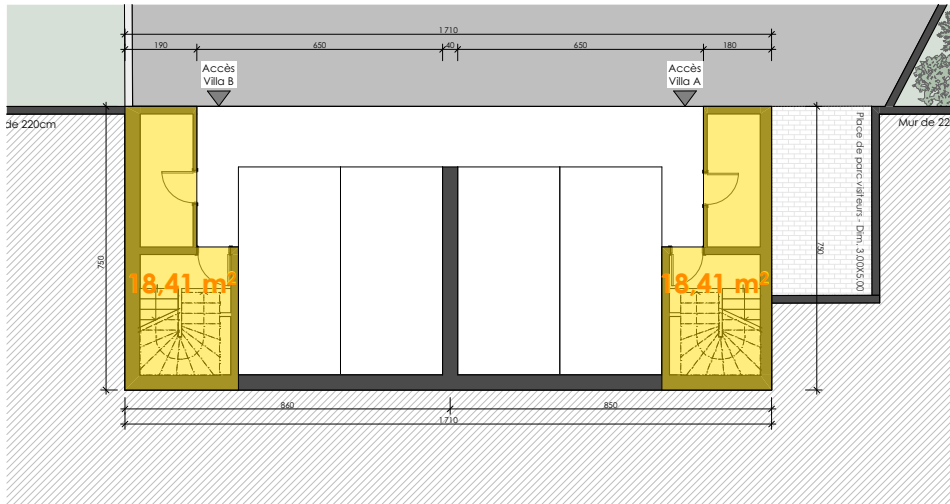
1/200 PLAN SOUS-SOL